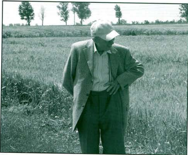
85 évesen a növénynevelők idei vándorgyűlésén (Karcag, 2005. június)

A Professor Úr 31 éven keresztül, 1985-ig vezette a tanszékét, 1990-ben, 70 évesen ment nyugdíjba. Azonban most, 2005-ben is, amikor oktatói pályafutásának 55 éves, professzori kinevezésének 52 éves jubileumát is ünnepeljük, éppen olyan agilitással jár ki Budapestről az egyetemre és töretlen fiatalos kedvvel végzi munkáját, oktatja az általa meghirdetett tárgyakat mint azt tette az ötvenes, hatvanas, hetvenes, nyolcvanas vagy kilencvenes években. Fél évszázad óriási idő egy professzor életében, hiszen több generációt nevelhetett és indíthatott útnak. Az alábbiakban a teljesség igénye nélkül szeretném összefoglalni azokat a legfontosabb momentumokat, melyek iskolateremtő munkásságát legjobban fémjelzik.